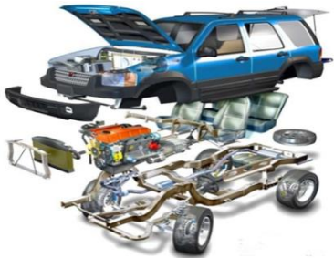
ยานยนต์และชิ้นส่วน