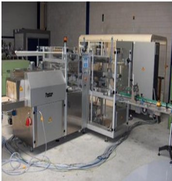
เครื่องจักรกล