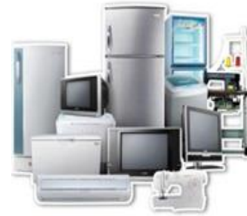
ไฟฟ้าและอิเล็กทรอนิกส์