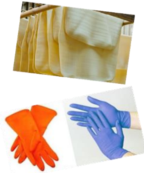
ยางและผลิตภัณฑ์ยาง